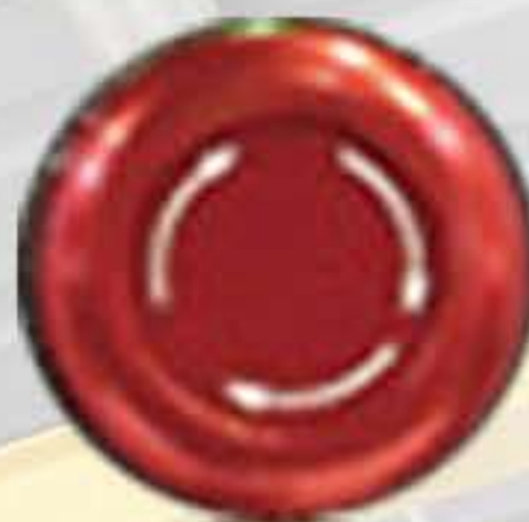
비상 정지 푸시 버튼