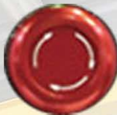
비상 정지 푸시 버튼