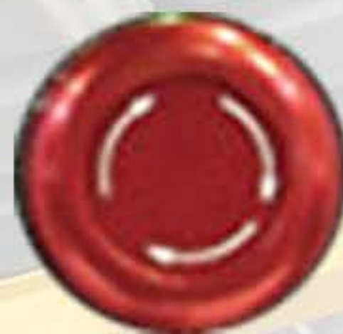
비상 정지 푸시 버튼