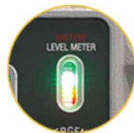
충전 및 배터리 레벨 게이지