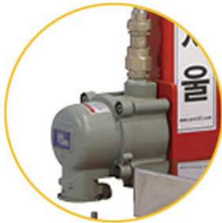
Receptacle+ (AC220V, 20A)