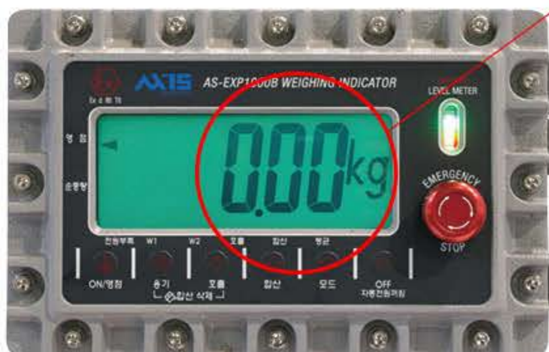
방폭형 충전 인디케이터