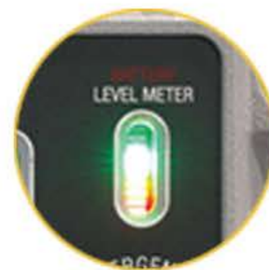
충전 및 배터리 레벨 게이지