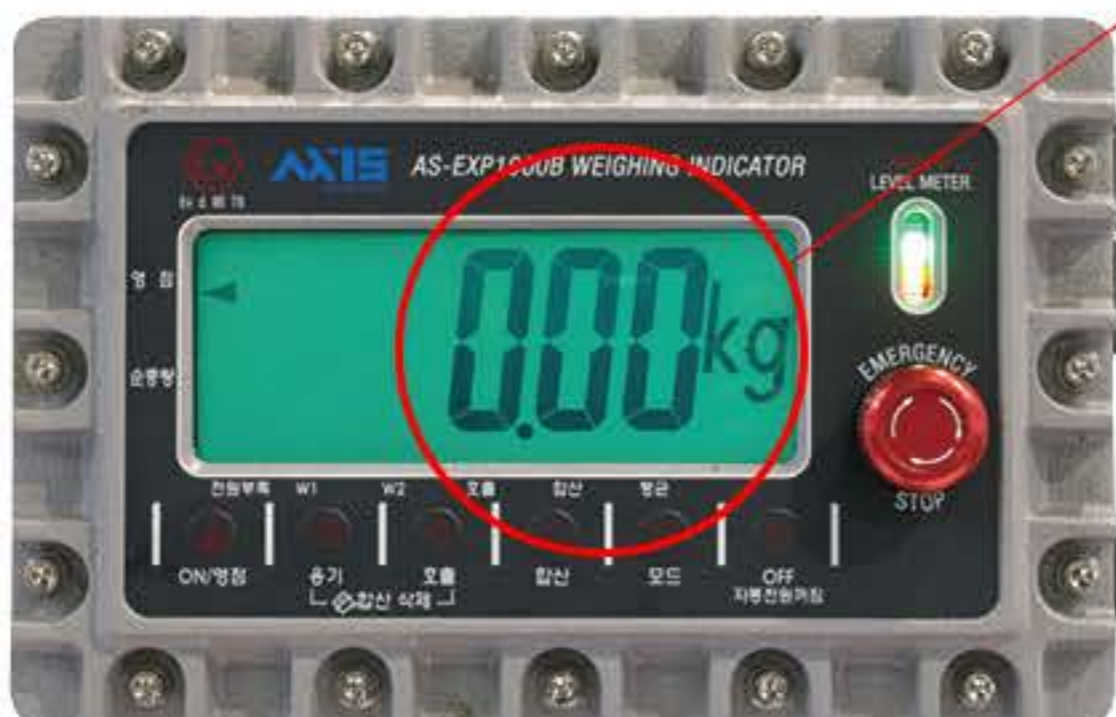
방폭형 충전 인디케이터

Plug 20A 이하는 사용자 Receptacle 사양에 맞춰 공급 (20A 이상 옵션 사항)