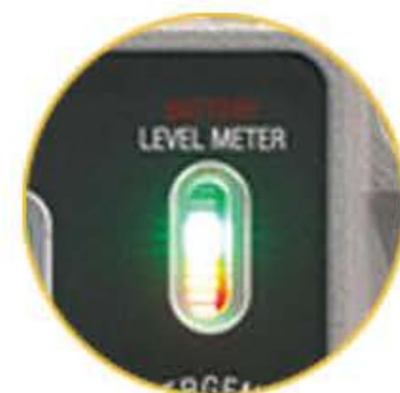
충전 및 배터리 레벨 게이지