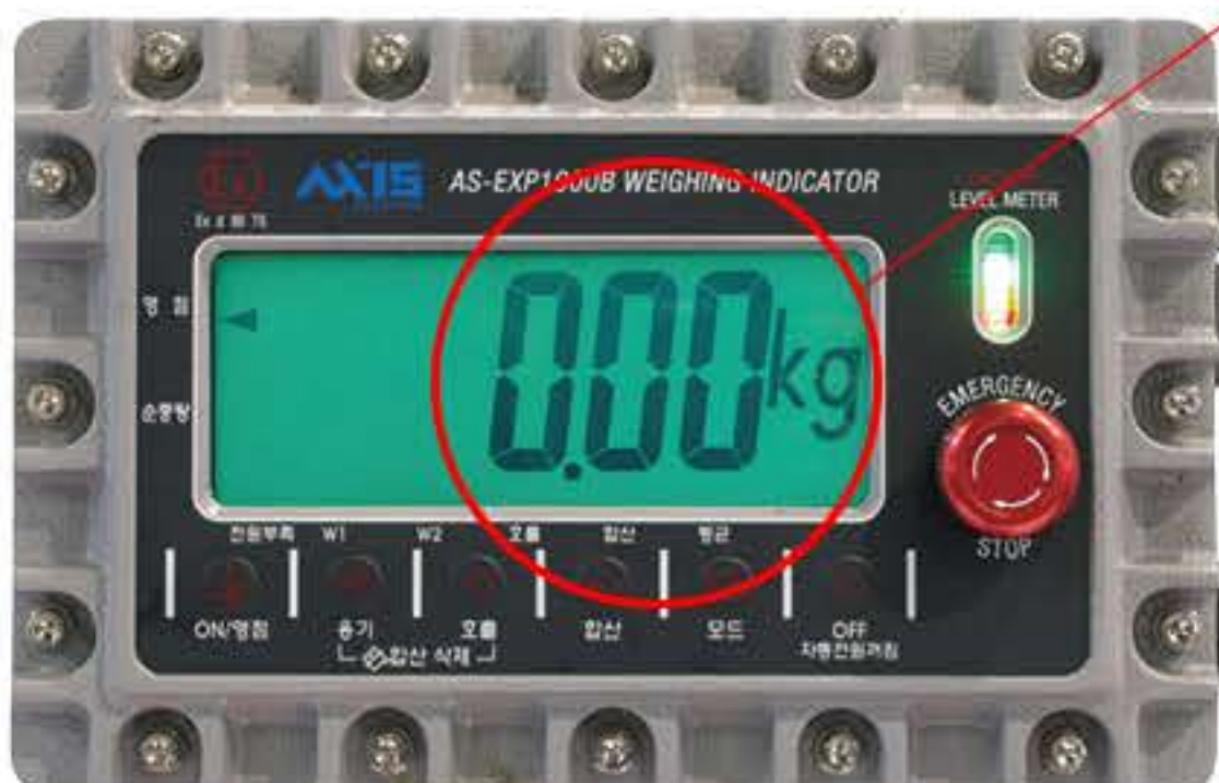
방폭형 충전 인디케이터

Plug 20A 이하는 사용자 Receptacle 사양에 맞춰 공급 (20A 이상 옵션 사항)