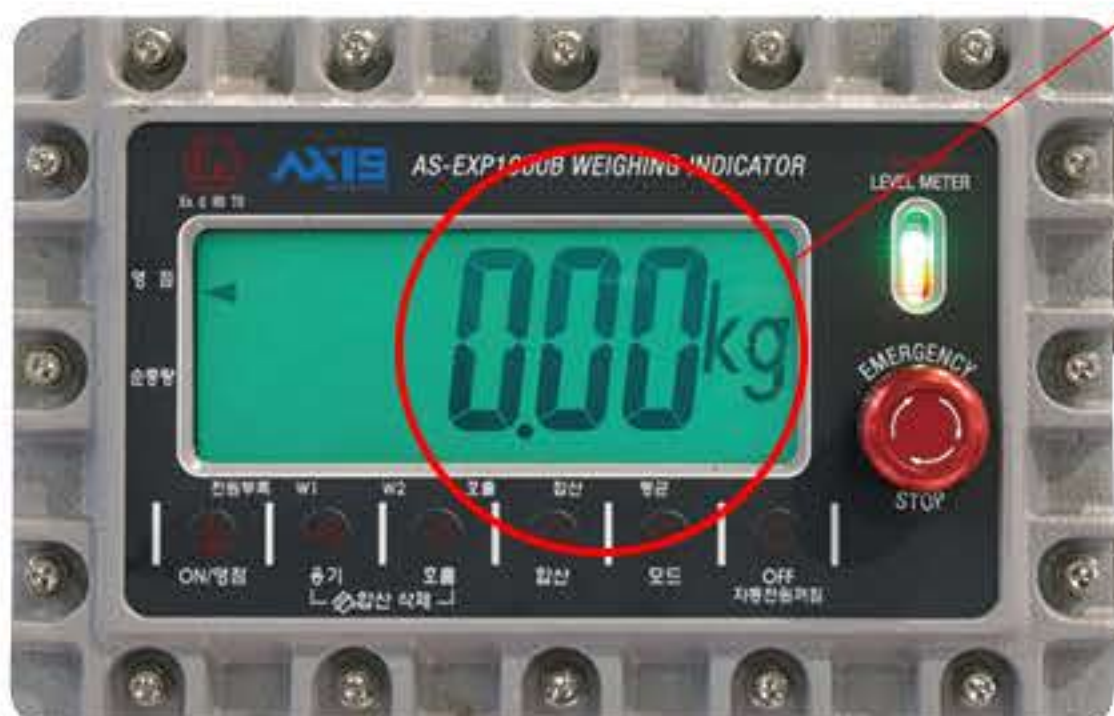
방폭형 충전 인디케이터