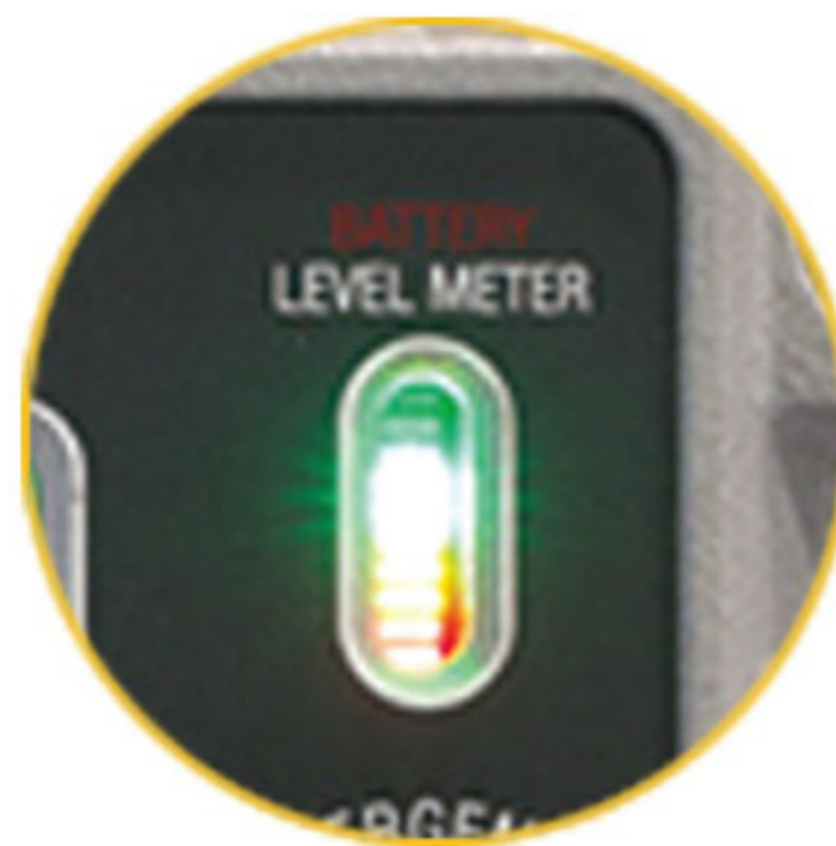
충전 및 배터리 레벨 게이지