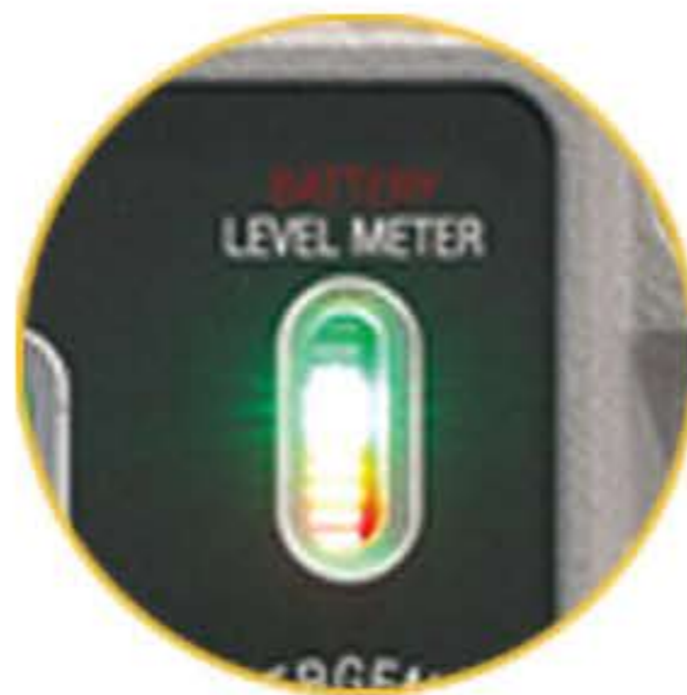
충전 및 배터리 레벨 게이지