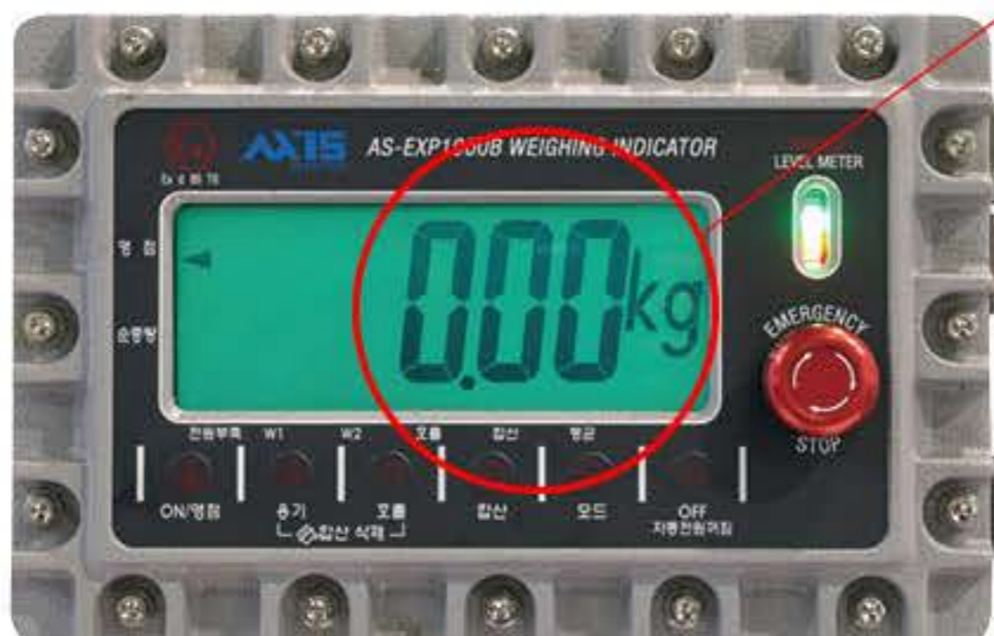
방폭형 충전 인디케이터