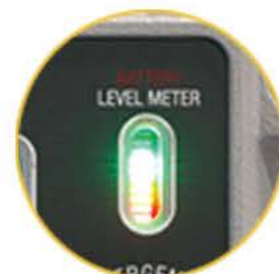
충전 및 배터리 레벨 게이지