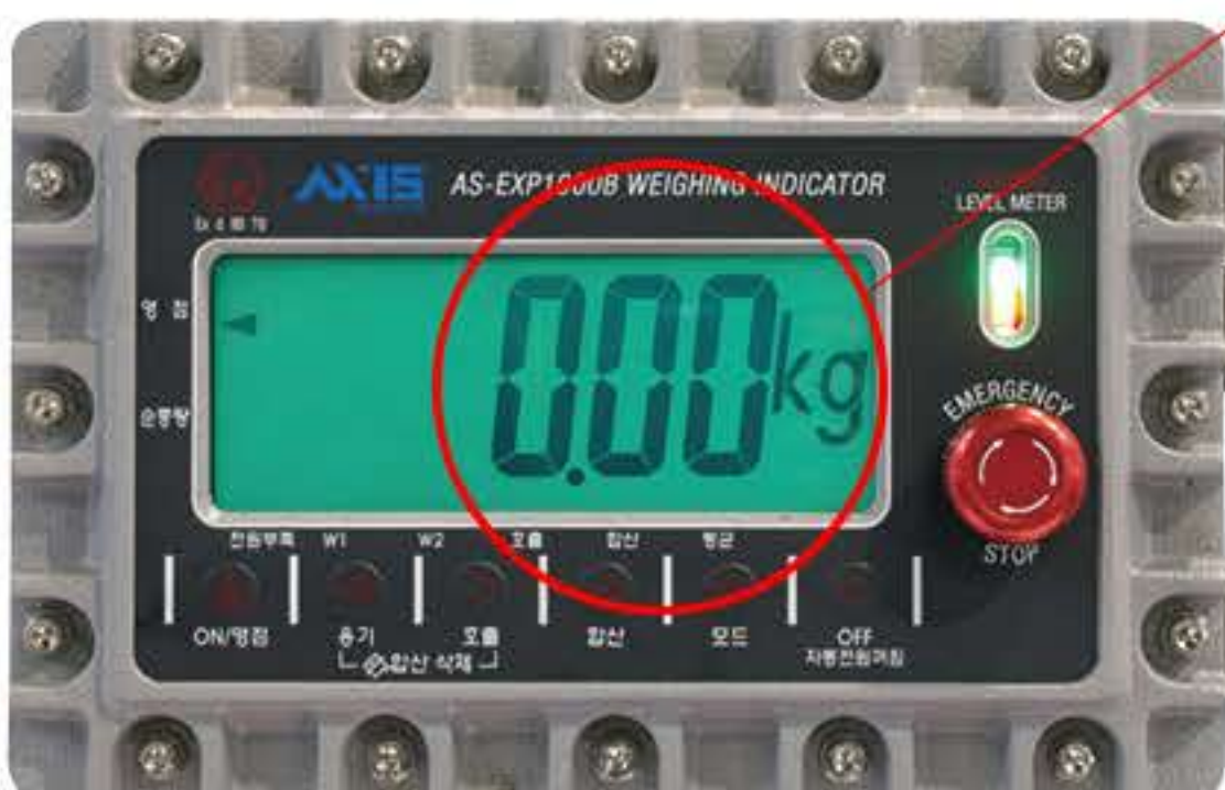
방폭형 충전 인디케이터

Plug 20A 이하는 사용자 Receptacle 사양에 맞춰 공급 (20A 이상 옵션 사항)