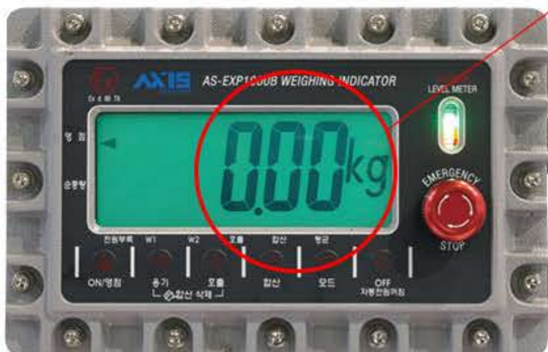
방폭형 충전 인디케이터