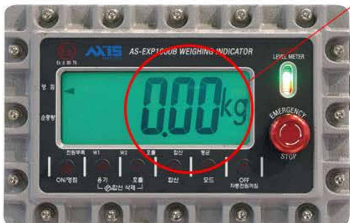
방폭형 충전 인디케이터