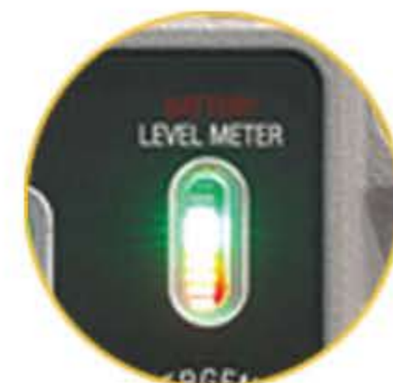
충전 및 배터리 레벨 게이지