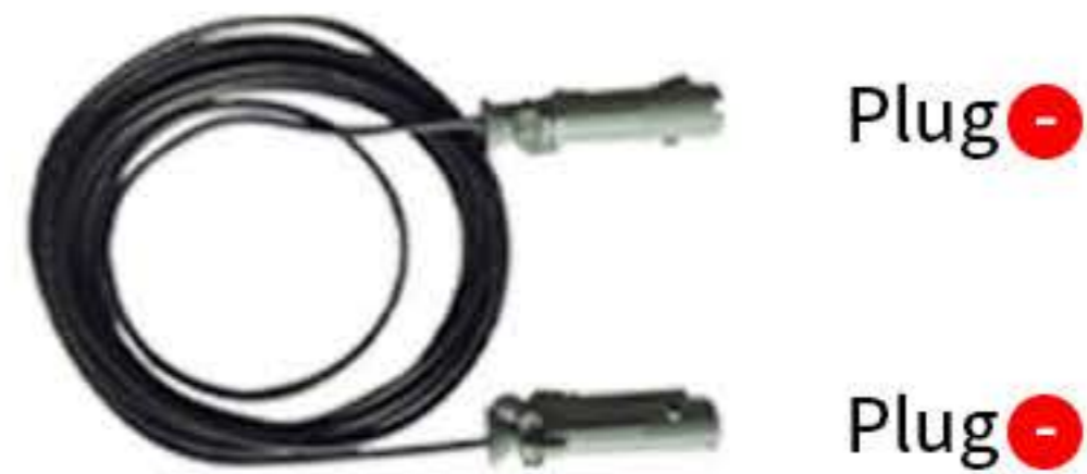
Plug 20A 이하는 사용자 Receptacle 사양에 맞춰 공급 (20A 이상 옵션 사항)