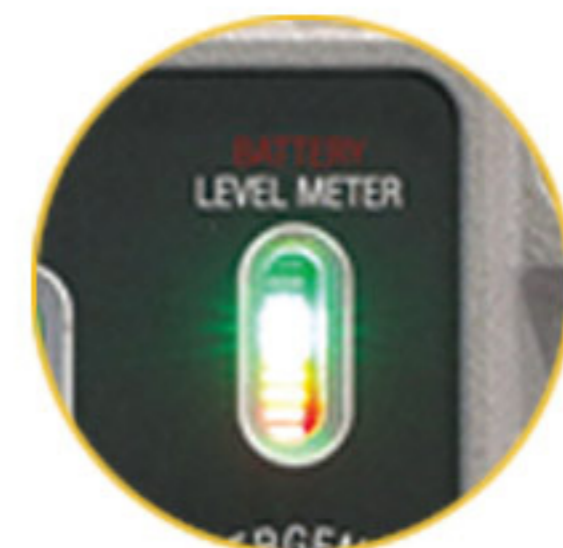
충전 및 배터리 레벨 게이지