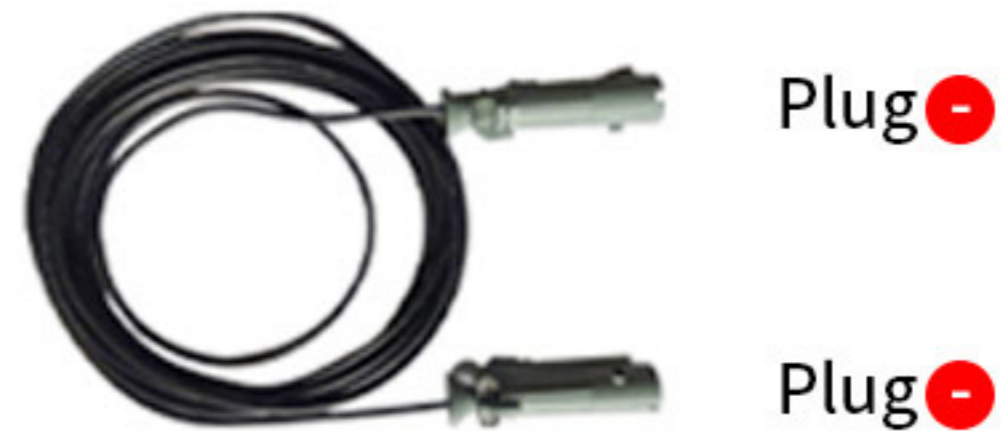
Plug 20A 이하는 사용자 Receptacle 사양에 맞춰 공급 ( 20A 이상 옵션 사항)