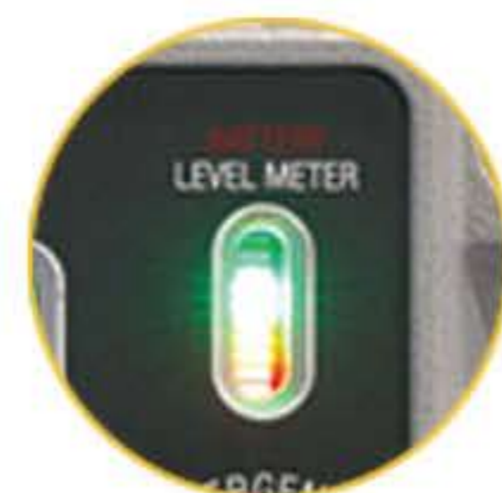
충전 및 배터리 레벨 게이지