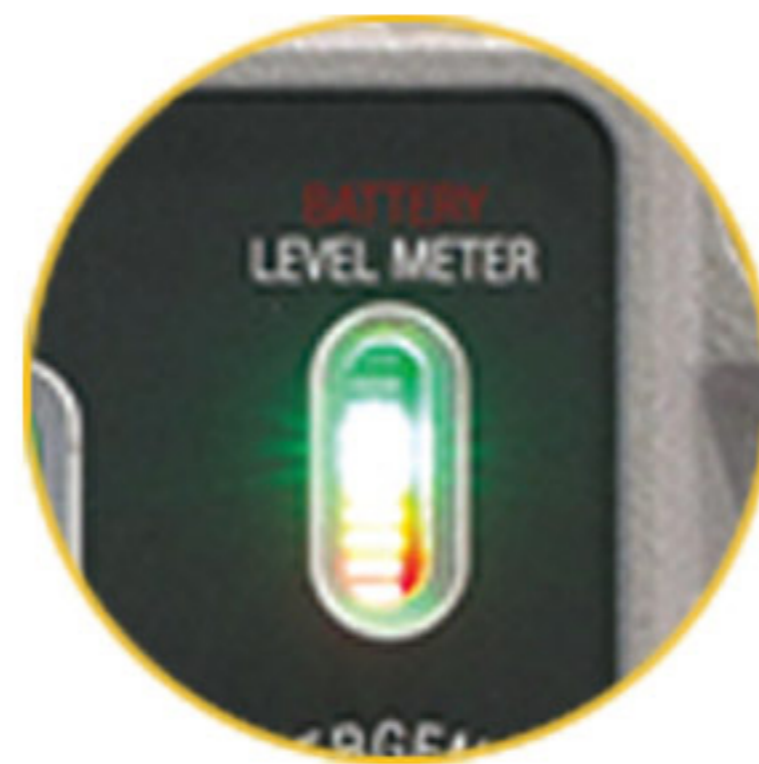
충전 및 배터리 레벨 게이지