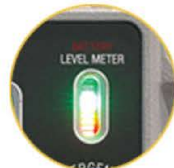
충전 및 배터리 레벨 게이지