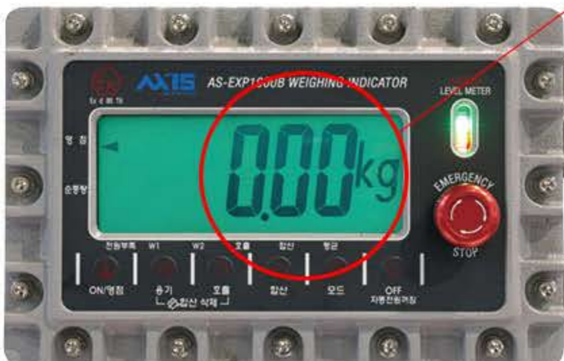
방폭형 충전 인디케이터

Plug 20A 이하는 사용자 Receptacle 사양에 맞춰 공급 (20A 이상 옵션 사항)