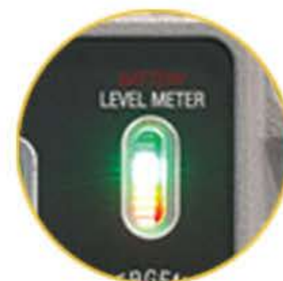
충전 및 배터리 레벨 게이지