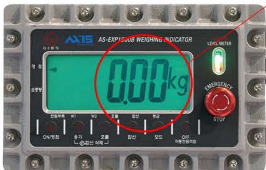
방폭형 충전 인디케이터

Plug 20A 이하는 사용자 Receptacle 사양에 맞춰 공급 (20A 이상 옵션 사항)