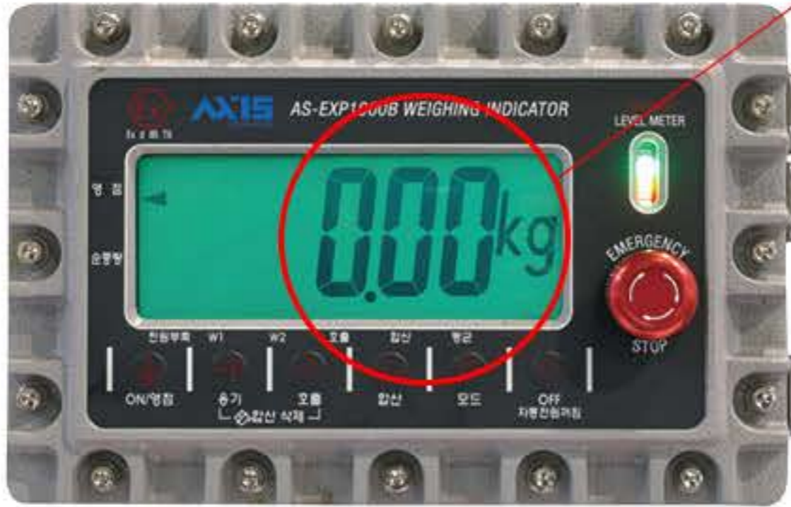
방폭형 충전 인디케이터