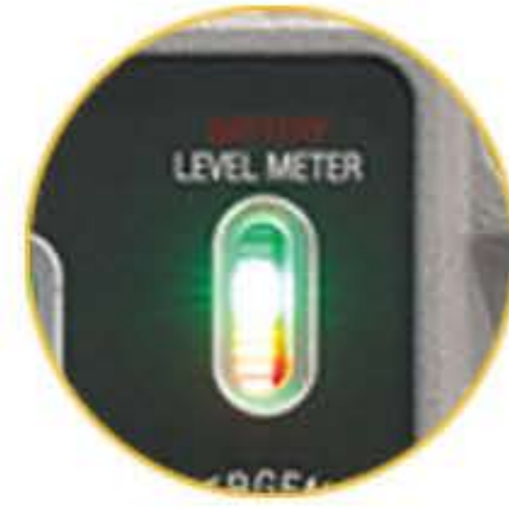
충전 및 배터리 레벨 게이지