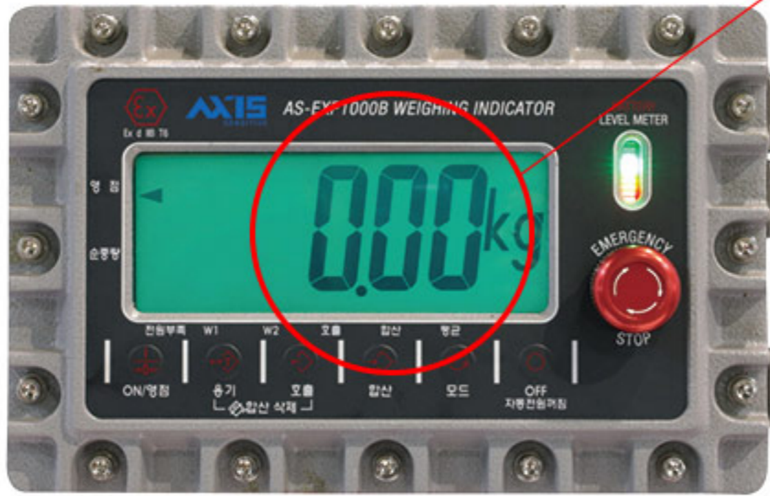
방폭형 충전 인디케이터