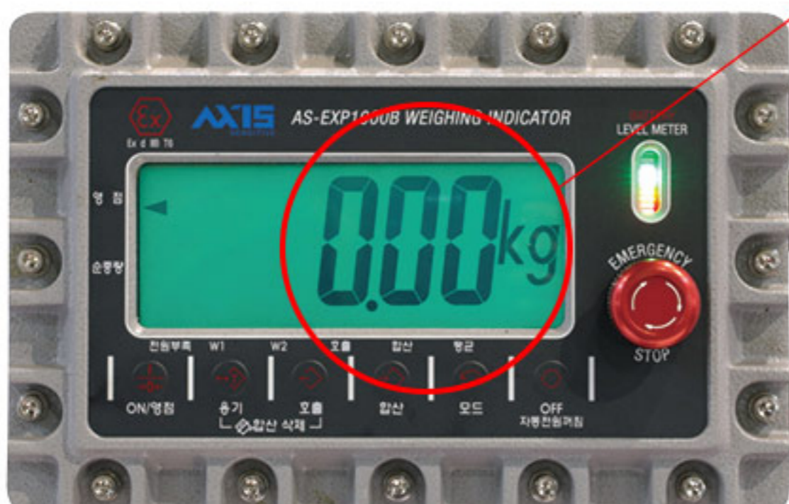
방폭형 충전 인디케이터