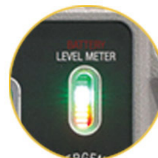
충전 및 배터리 레벨 게이지