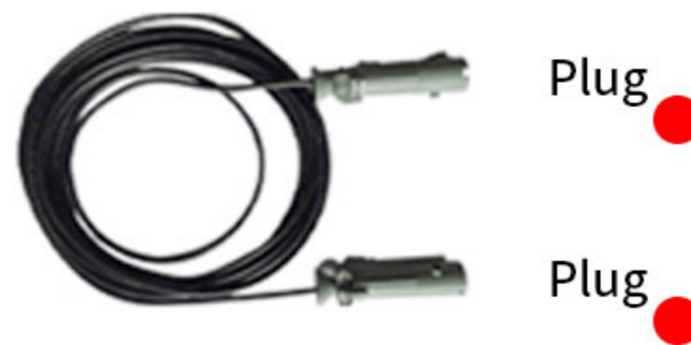
Plug 20A 이하는 사용자 Receptacle 사양에 맞춰 공급 (20A 이상 옵션 사항)