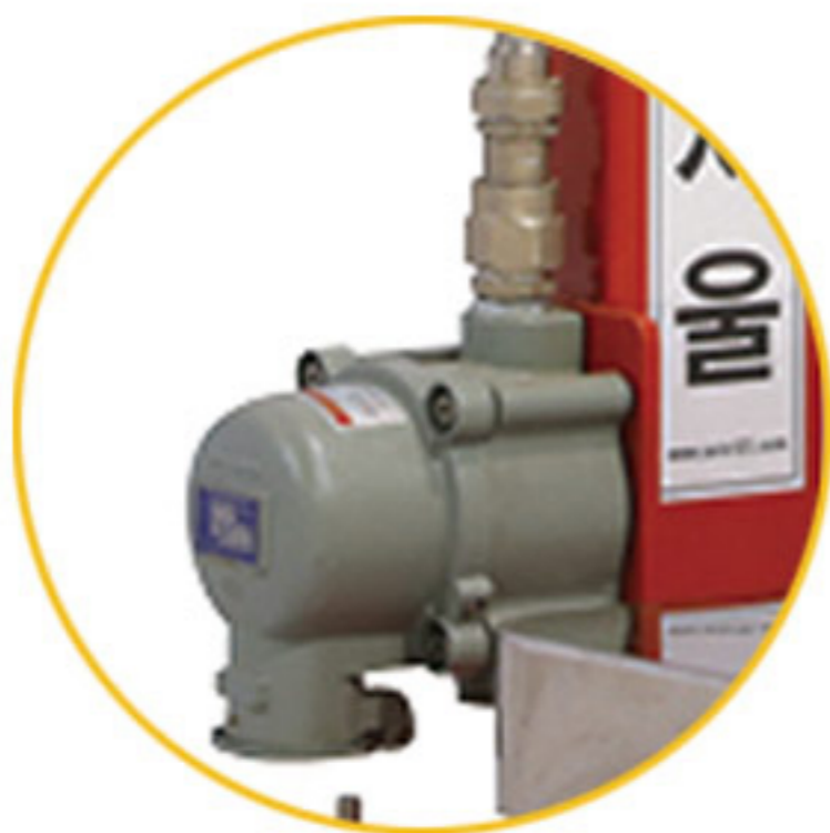
Receptacle (AC220V, 20A)