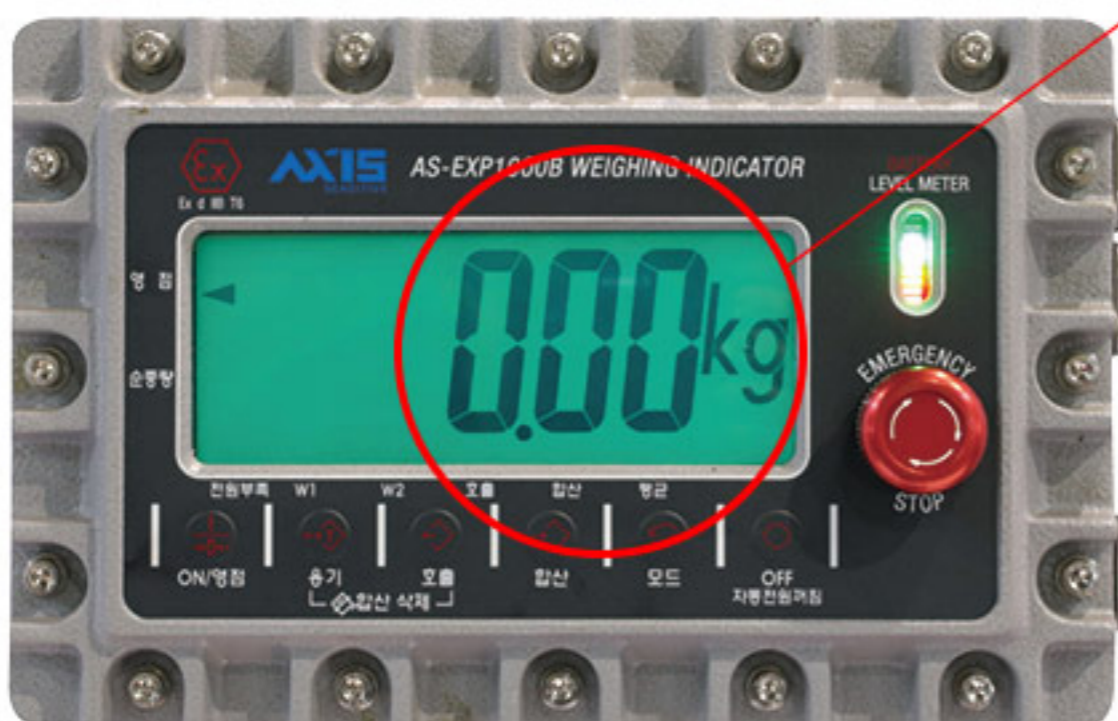
방폭형 충전 인디케이터